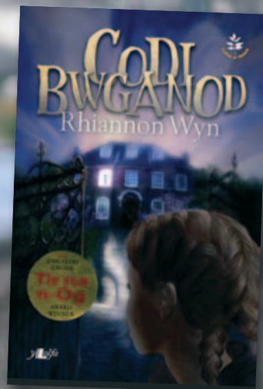
Codi Bwganod Y Lolfa £5.95